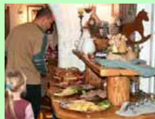
Im abwechslungsreichen Speiseplan ist für jeden etwas dabei