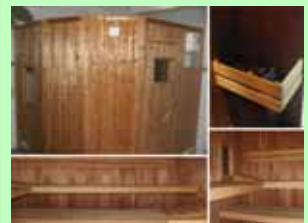
Sauna in der Hubertus-Tenne