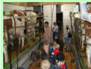
Ein besonderes Erlebnis ist für die Kinder immer wieder das Melken