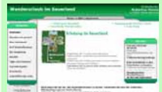
Internetauftritt des Hubertushofes