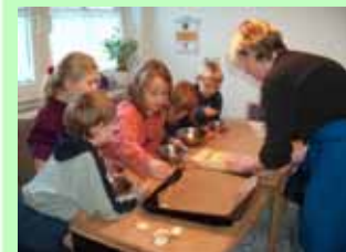
Plätzchenbacken in der Weihnachtszeit wird auf dem Hubertushof seit vielen Jahren angeboten