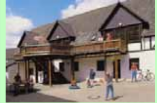
Ferienwohnungen an Hubertus-Tenne

Ausführliche Informationen enthalten die Internetseite der Hubertus-Tenne unter http://www.bilderbuchpension.de und die Informationsseiten für wanderfreudige Gäste unter http://www.wanderurlaub-sauerland.de .