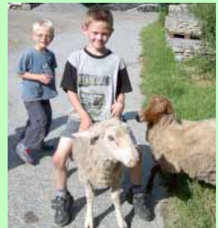
Mit den Tieren spielen wird auf dem Hubertushof groß geschrieben