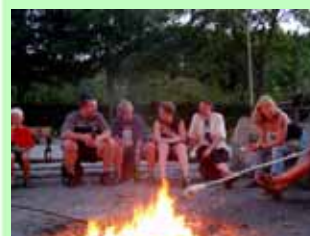
Gemeinsame Abende am Lagerfeuer mit Stockbrotbacken