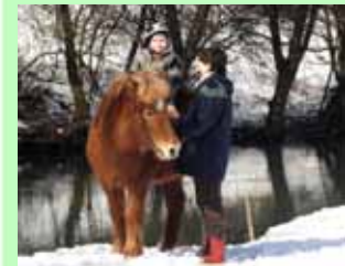
Das Reiten auf unseren Pferden bieten wir ganzjährig an.