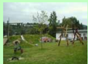
Hauseigener Spielplatz an der Hubertus-Tenne