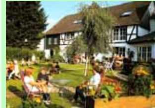
In unserem großen Garten gibt es viel Spielraum für die Kinder und Ruhezeiten für die Erwachsenen

Wir sind immer bemüht, unser Angebot zu erweitern und berichten darüber per Internet und per Rundschreiben an mögliche Gäste.