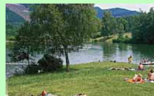
Viele Gäste fahren in den Sommermonaten zum Baden an den Esmecke-Stausee

Für die Selbstversorger unter unseren Gästen bietet unser Bäcker einen Brötchenservice an.