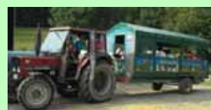
Mit unserem Planwagen unternehmen wir mit unseren Gästen Fahrten zum Melkstatt und in die Sauerländer Umgebung