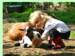
Der Streichelzoo – nicht nur für die ganz Kleinen