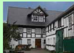
Vorderansicht vom Hubertushof

Am Nachmittag wird Kaffee und hauseigener Kuchen als zusätzliches Angebot bereitgehalten.