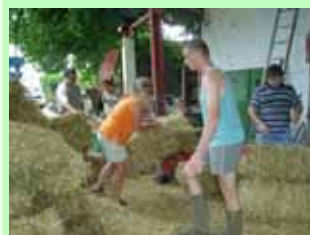
Aktiver Landurlaub ist auf dem Hubertushof kein Fremdwort