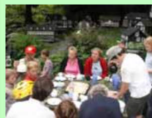
Verpflegung unserer Gäste bei einer Wanderung zum Hammerkotten