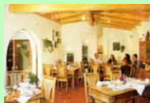
Speisesaal auf dem Hubertushof