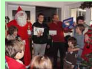
Spendenübergabe durch den Nikolaus beim Weihnachtsbaumschlagen 2005