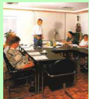
Tagungsraum auf der Hubertus-Tenne