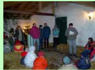
Mittendrin statt nur dabei – bei den Aktionswochenenden werden alle Gäste sowie die Gastgeber in die Spiele einbezogen