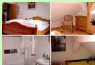
Familienzimmer auf dem Hubertushof