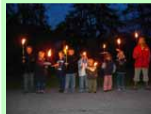
Fackelwanderungen gehören zum ganzjährigen Angebot

Die kleinen Gäste erhalten am Ende ihres Aufenthaltes ein Hubertushof-Bauernhof-Diplom, in dem die durchgeführten Tätigkeiten dokumentiert werden.