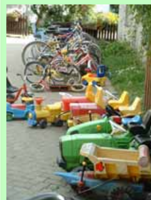
Der „Fahrpark“ für die kleinsten Gäste